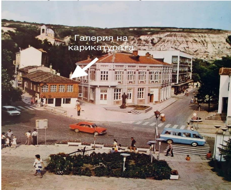
Фиг. 4 Галерия на българската карикатура

Кречмар и др. Галерията на карикатурата просъществува до 1987 г., а колекцията и става част от фонда на новооткритата художествена галерия. 27