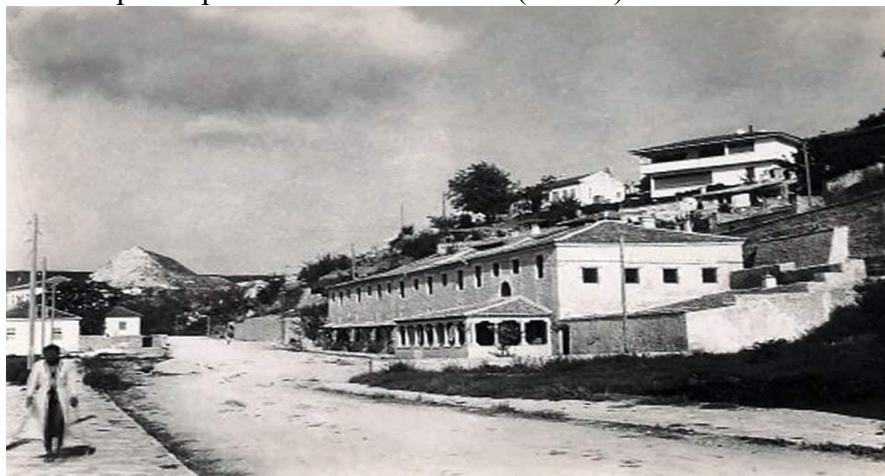
Фиг. 3 Първия музей-галерия в Южна Добруджа