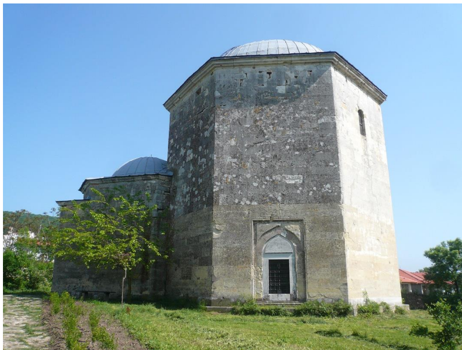
Теке „Ак Язълъ Баба“, с. Оброчице