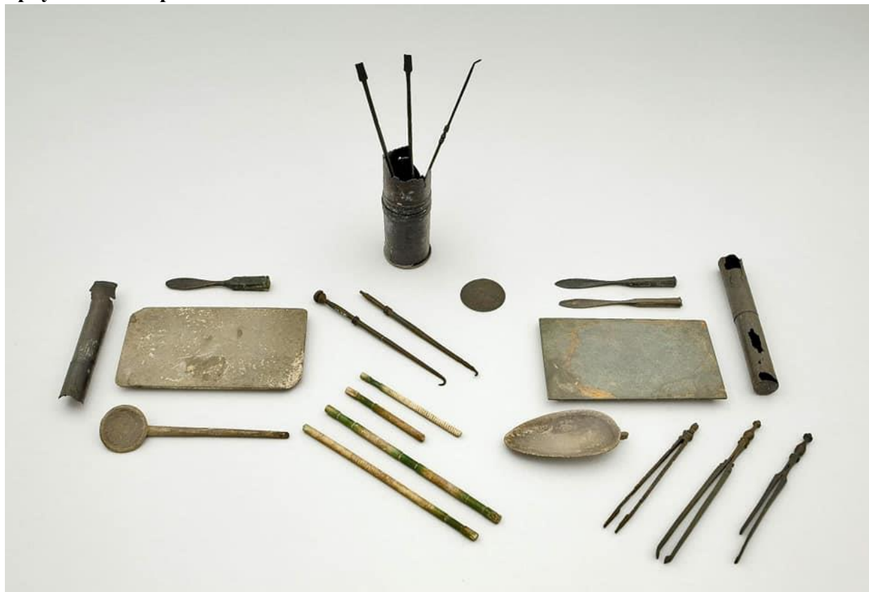
Фиг. 2 Хирургически инструменти на лекар жрец от II в.сл.Хр

това случайно откритие, на 24 юли 1907 г., започват първите археологически проучвания в град Балчик. 4