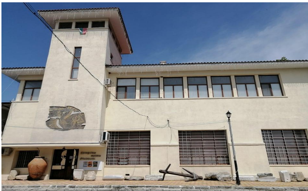
Исторически музей – Балчик